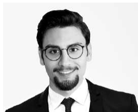
JAN POMÉS LÓPEZ

El Eurogrupo ha aprobado movilizar una línea de crédito para los Estados para financiar fondos de apoyo al financiamiento interno de los costos relacionados con la atención médica, la cura y la prevención directa e indirecta debido al Covid-19 por un valor de 240.000 millones de euros